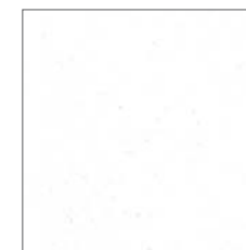
R-006 Cera / Off-White