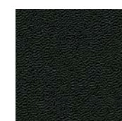
R-090 Negro / Black