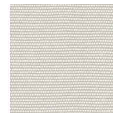
R-117 Crudo / Raw