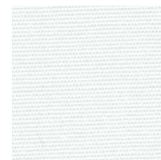
R-099 Blanco / White