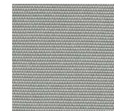
R-138 Nube / Cadet Grey