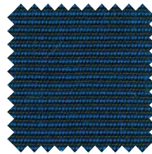
772 Tweed Azul