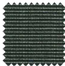
770 Tweed Gris