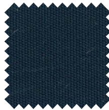
175 Azul Marino