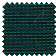
771 Tweed Verde