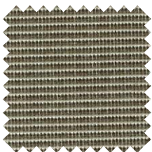
775 Tweed Lino