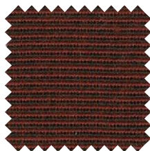
773 Tweed Rojo